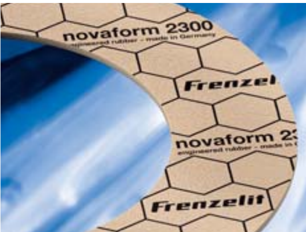
Bild 1: Der Dichtungswerkstoff Novaform schlägt eine Brücke zwischen reinen Elastomerdichtungen und kautschukgebundenen Faserstoffdichtungen

Eine neue Generation statischer Dichtungen vereint die Leistungsmerkmale aus zwei verschiedenen Produktgattungen: Sie ist anpassungsfähig wie eine Gummidichtung und verfügt gleichzeitig über die guten mechanischen Eigenschaften einer hochwertigen Faserstoffdichtung.